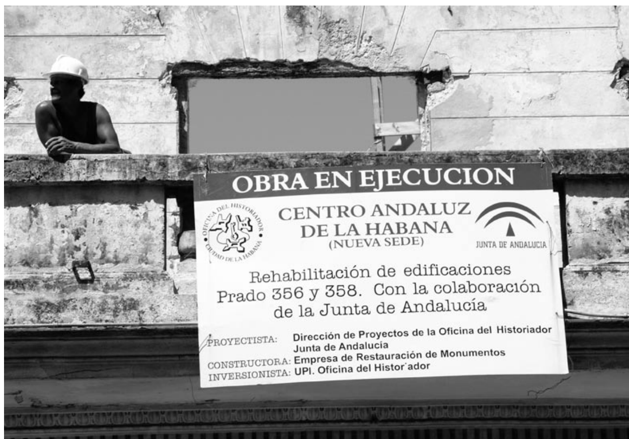
Reconstrucción de un edificio de La Habana, financiada por el Gobierno de la Comunidad Autónoma de Andalucía.

Es una práctica común situar en cada centro de trabajo –también en compañías extranjeras– a seguidores del Partido que tienen que controlar a compañeros de trabajo con actitudes cuestionables. Al realizar estas acciones, el Gobierno viola el convenio número 87 (sobre la libertad sindical y la protección del derecho de sindicación), artículo 3.2, donde reza que «las autoridades públicas deberán abstenerse de toda intervención que tienda a limitar este derecho o entorpecer su ejercicio legal».